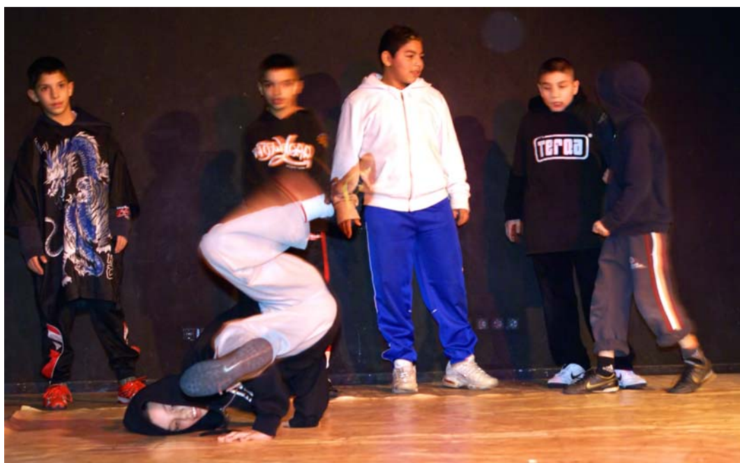
8. „Schöneberger Breakers“ Breakdance – Gruppe von Outreach