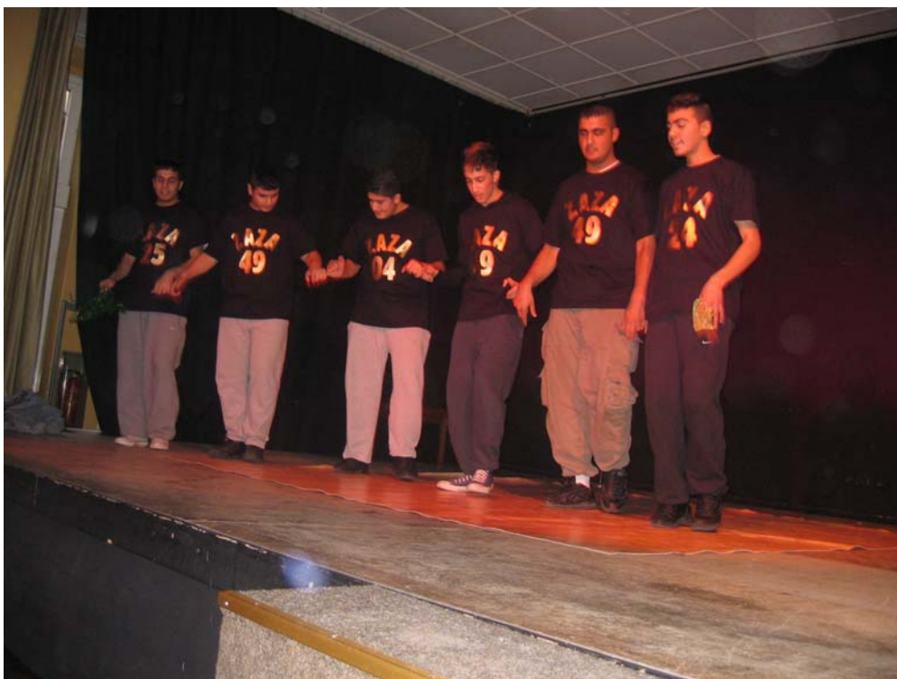
6. „Zaza“ Folkloregruppe von Treff 62