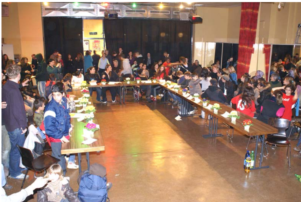
1. Kinder- und Jugendversammlung am 23.02.2007 im PallaSt