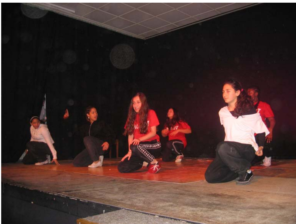
10. „Diamonds“ Tanzgruppe von Fresh 30