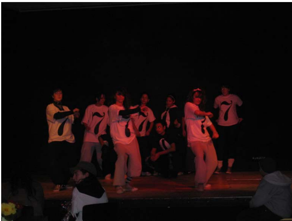
9. „Diamonds“ Tanzgruppe von Fresh 30