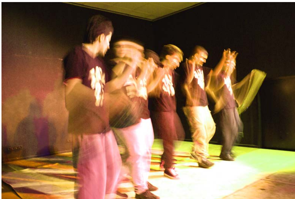
7. „Zaza“ Folkloregruppe von Treff 62