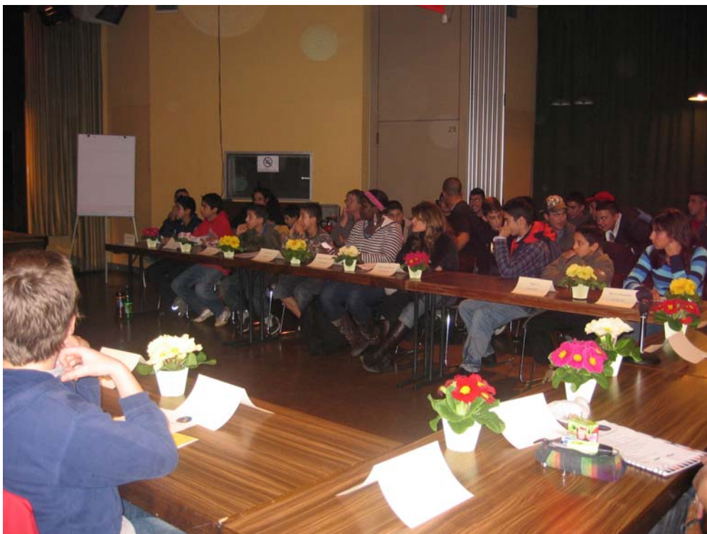
5. VertreterInnen der Einrichtungen am runden Tisch