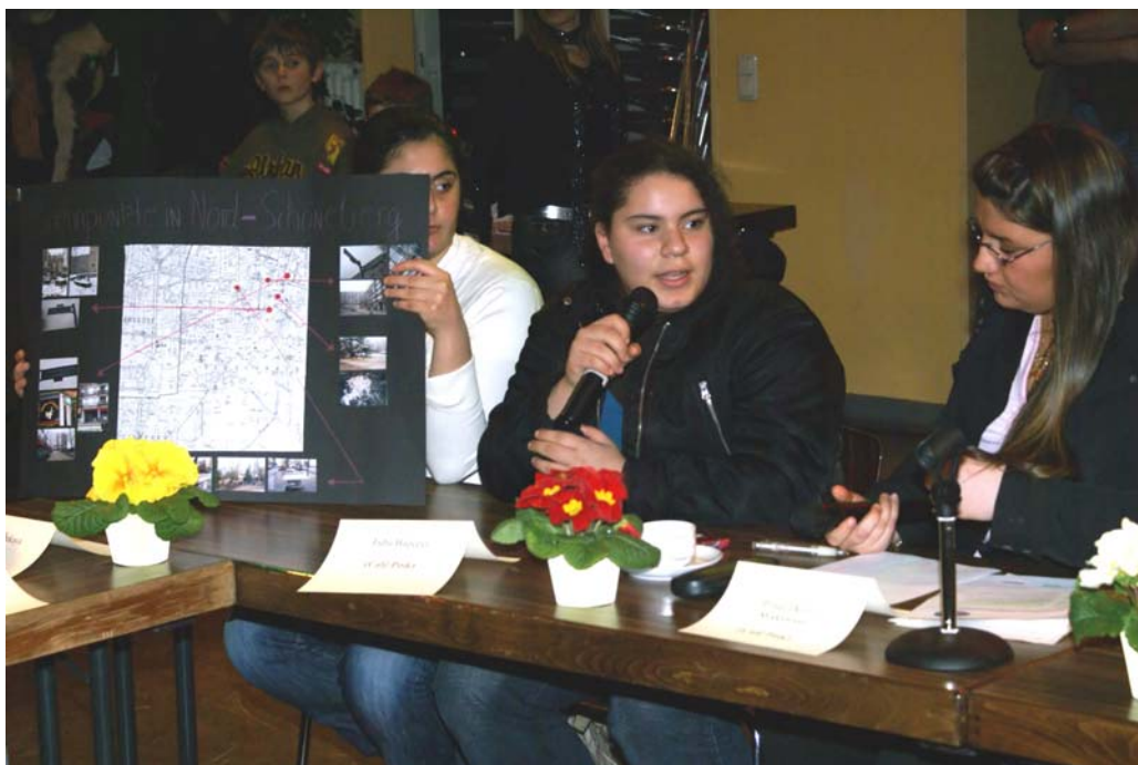
4. Jugendvertreterinnen aus dem Café Pink beschreiben ihr Anliegen