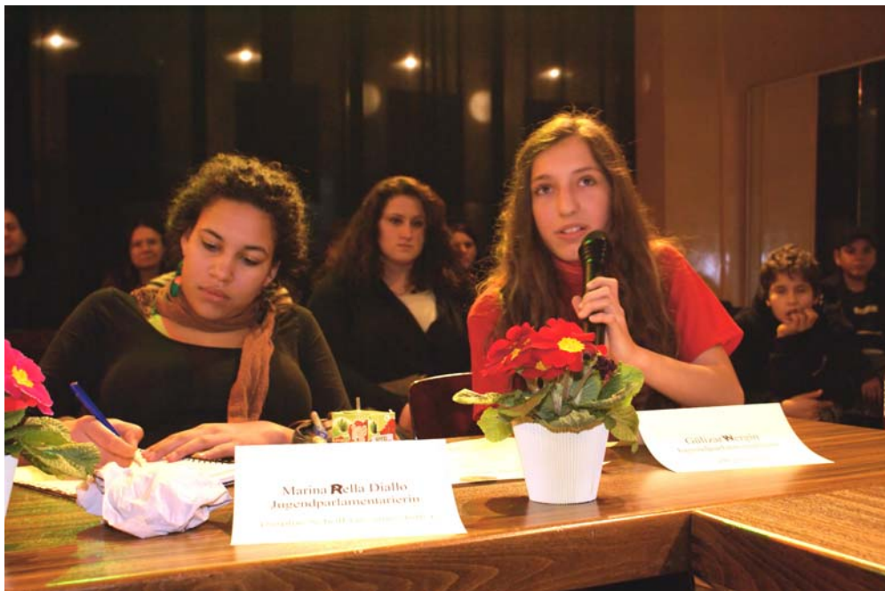
3. Jugendparlamentarierinnen aus Schöneberg-Nord